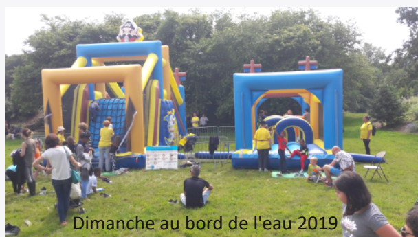
Dimanche au bord de l'eau 2019

Le programme détaillé de ce temps fort de quartier est en cours.