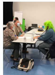
Lors de l'atelier du 13 mars, dans le cadre de l'accompagnement de la Fédération pour le transert de gestion.