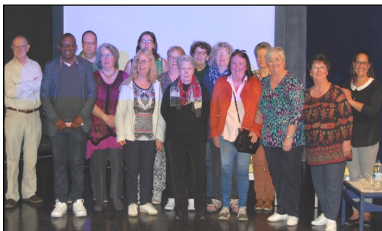
Les membres du Conseil d'Administration élus.