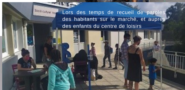
Lors des temps de recueil de paroles des habitants sur le marché, et auprès des enfants du centre de loisirs