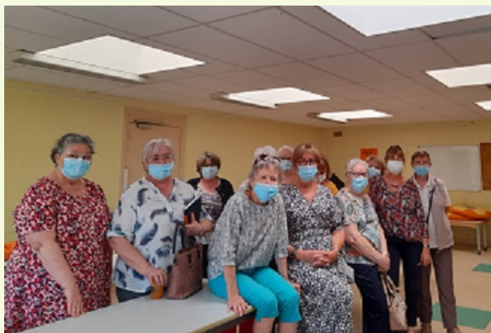
Les bénévoles des braderies

Aujourd'hui, je donne un coup de main sur place. Au-delà des prix mini, il y a la notion écologique du recyclage. On y trouve parfois de belles pièces de qualité et vintage."