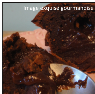
Image exquisite gourmandise

Chocolat noir 100 g 1 petite boîte de haricots rouges cuits (env. 300 g) 1 petite boîte de marrons au naturel (env. 300 g) Lait 100 ml Sucre 100 g 3 Œufs Levure chimique : 2 càc Épices en poudre : gingembre, cannelle,...