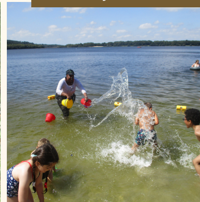
Sortie baignade au lac du Drenec