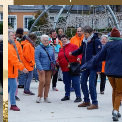
L'arrivée de l'automne a été bien fêtée avec le succès du disco soupe sur la place de Metz