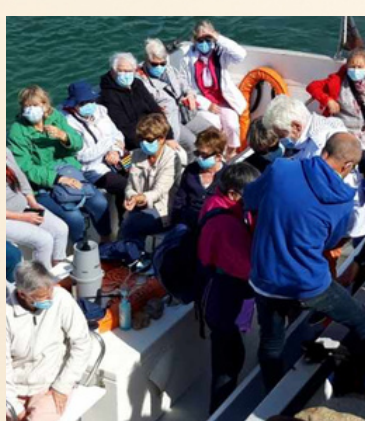
Les sorties pour tous embarquent pour les grottes du Morgat