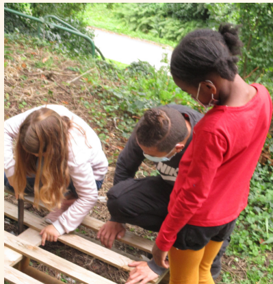
Bricolage et jardinage