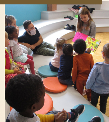
Temps calme à la médiathèque animé par les 10-14 ans