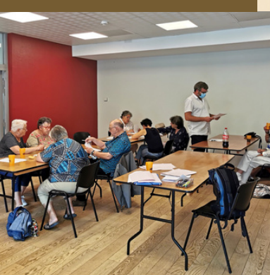
Une journée riche en travail, échanges et convivialité