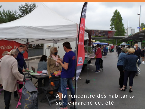
A la rencontre des habitants sur le marché cet été