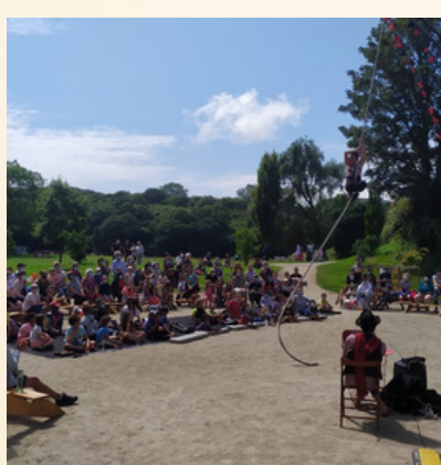
Spectacles à Penfeld et à Kerbernier