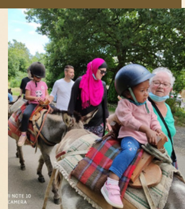
Les sorties familiales au parc naturel Océ'ânes à Lanvéoc