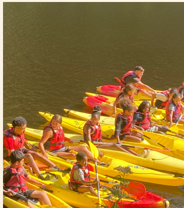
Initiation Kayak à Penfeld avec sport et quartier