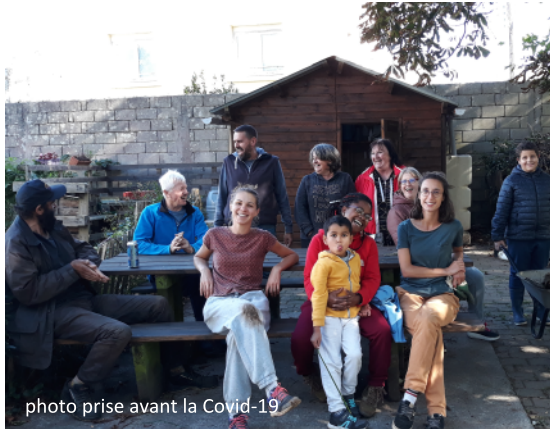
photo prise avant la Covid-19

apportent un soutien technique et logistique. Elles se réunissent tous les vendredis après-midi dans une ambiance conviviale et contribuent ainsi, par leur action, à améliorer le cadre de vie du quartier.